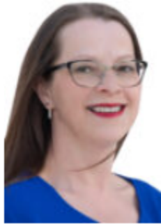
Kaoke Kärdi Koordinaator