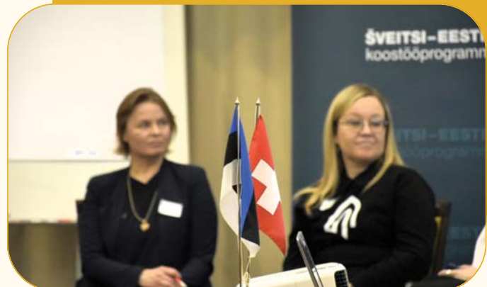
Eesti-Šveitsi koostööprogrammi KÜSKi osalusega meetme avasündmus.

Seda nii organisatsiooni arendamiseks, konkreetsete tegevuste planeerimiseks, tegevuseks vajaliku raha kavandamiseks ja juhtimiseks (sh omatulu teenimise arendamiseks), kommunikatsioonitegevusteks, teenuste, koostöö arendamiseks ja oma mõju hindamiseks jne.