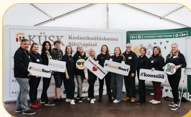
KÜSKi kollektiiv SUMINARII 2025.

KÜSKi rahastustaotlusi hindavad hindajate kogu hindajad – kodanikuühiskonna erinevate valdkondade eksperdid, kes nimetati 2025. aasta veebruaris pärast tihedat uute hindajate konkursi perioodiks 2025–2027.