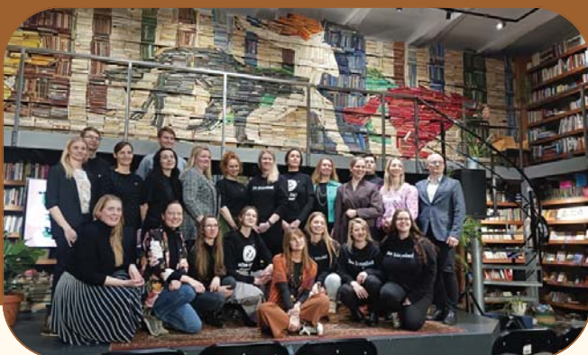
NULA 9. hooaja lõpu- ja 10. hooaja avasündmus.

Nupukate lahenduste ehk NULA inkubaator ja starditoetuste konkurss on toimiv koostöö Heateo SA-ga, kes on NULA inkubaatori rakenduspartner aastatel 2024–2026. NULA inkubaator pakub inimestele ja meeskondadele mentorlust kogu arenguprogrammi käigus. Senise kogemuse põhjal on NULA inkubaator aidanud uuenduslikel ideedel kiiremini kasvada elujõulisteks sotsiaal- või äriprojektideks. Kogu arenguprogramm peab kaasa aitama mõne elulise kitsaskoha lahendamisele ja uuendusliku idee väljatöötamisele, millel on innovatiivne ja sotsiaalne mõõde. 2025. aastal lisati inkubatsiooni 10 uut meeskonda.