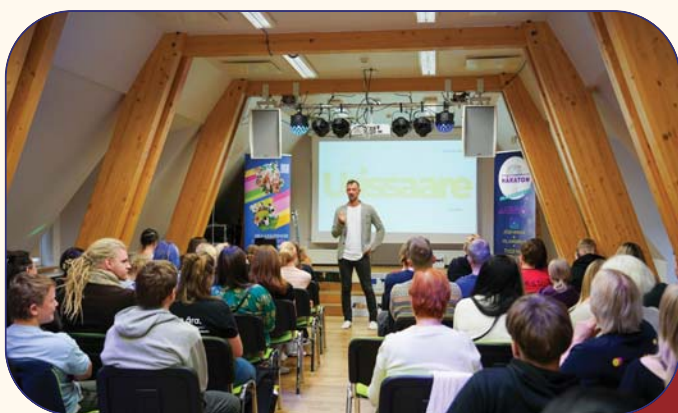
Viljandi- ja Jõgevamaa noorte ja kogukondade häkaton.

2025. aastal alustasid sisuliste tegevustega mitmed välisrahastusega programmid, mille ettevalmistus algas juba aasta varem.