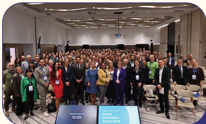
Sotsiaalse innovatsiooni foorum.

2025. aasta tegevused toimusid mahus 15 939 eurot .