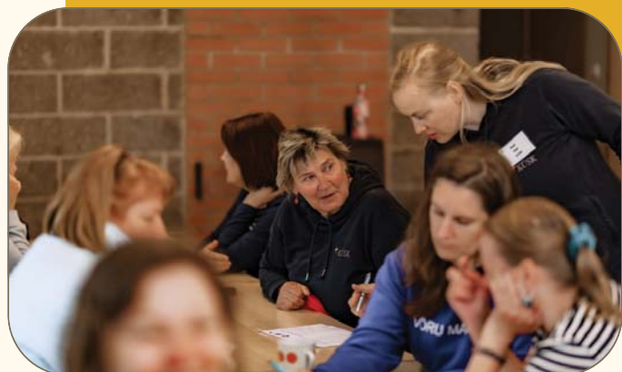
Suminaril lõppes vabaühenduste konsultantide arenguprogramm.

2025. aastal teostati tegevusi mahus 431 285 eurot.