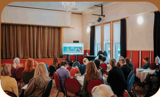
Kogukondadevahelise koostöö teemadele pühendatud arengupäev.

Kontaktpunkti tegevusteks kasutati 2025. aastal 31 118 eurot .