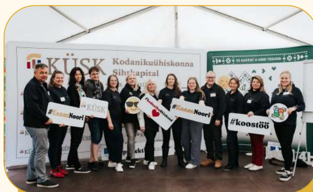
KÜSKi kollektiiv SUMINARII 2025.

KÜSKi rahastustaotlusi hindavad hindajate kogu hindajad – kodanikuühiskonna erinevate valdkondade eksperdid, kes nimetati 2025. aasta veebruaris pärast tihedat uute hindajate konkursi perioodiks 2025–2027.