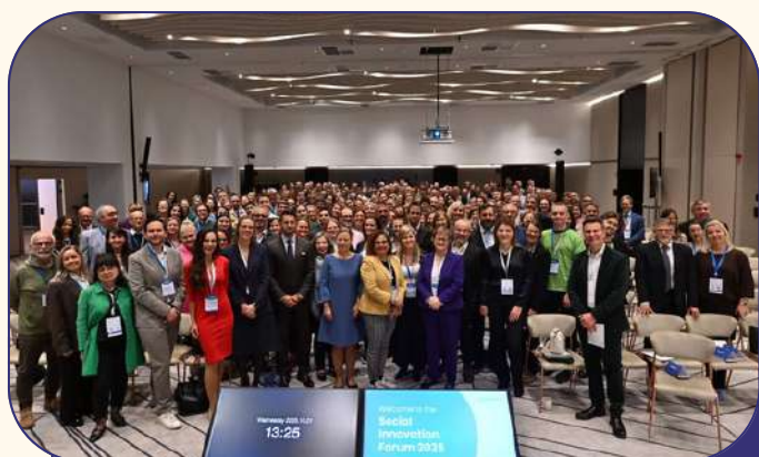
Sotsiaalse innovatsiooni foorum.

2025. aasta tegevused toimusid mahus 15 939 eurot .