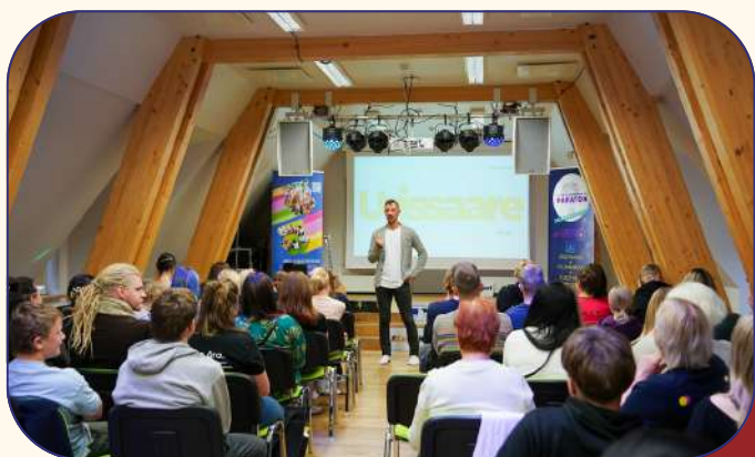
Viljandi- ja Jõgevamaa noorte ja kogukondade häkaton.

2025. aastal teostati tegevusi mahus 431 285 eurot.