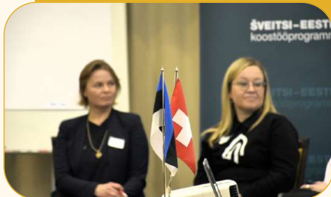
Eesti-Šveitsi koostööprogrammi KÜSKi osalusega meetme avasündmus.

Seda nii organisatsiooni arendamiseks, konkreetsete tegevuste planeerimiseks, tegevuseks vajaliku raha kavandamiseks ja juhtimiseks (sh omatulu teenimise arendamiseks), kommunikatsioonitegevusteks, teenuste, koostöö arendamiseks ja oma mõju hindamiseks jne.