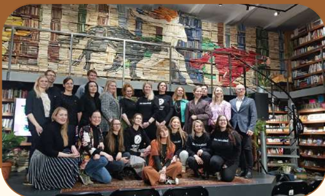
NULA 9. hooaja lõpu- ja 10. hooaja avasündmus.

Nupukate lahenduste ehk NULA inkubaator ja starditoetuste konkurss on toimiv koostöö Heateo SA-ga, kes on NULA inkubaatori rakenduspartner aastatel 2024–2026. NULA inkubaator pakub inimestele ja meeskondadele mentorlust kogu arenguprogrammi käigus. Senise kogemuse põhjal on NULA inkubaator aidanud uuenduslikel ideedel kiiremini kasvada elujõulisteks sotsiaal- või äriprojektideks. Kogu arenguprogramm peab kaasa aitama mõne elulise kitsaskoha lahendamisele ja uuendusliku idee väljatöötamisele, millel on innovatiivne ja sotsiaalne mõõde. 2025. aastal lisati inkubatsiooni 10 uut meeskonda.