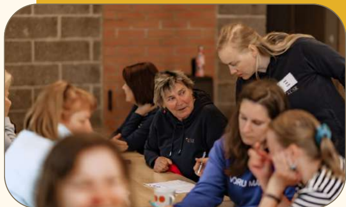
Suminaril lõppes vabaühenduste konsultantide arenguprogramm.