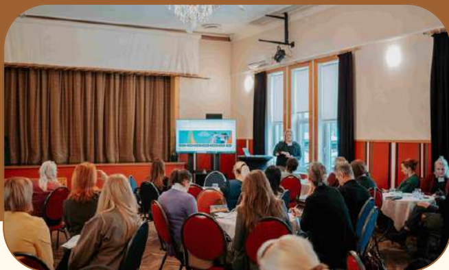
Kogukondadevahelise koostöö teemadele pühendatud arengupäev.

Kontaktpunkti tegevusteks kasutati 2025. aastal 31 118 eurot .