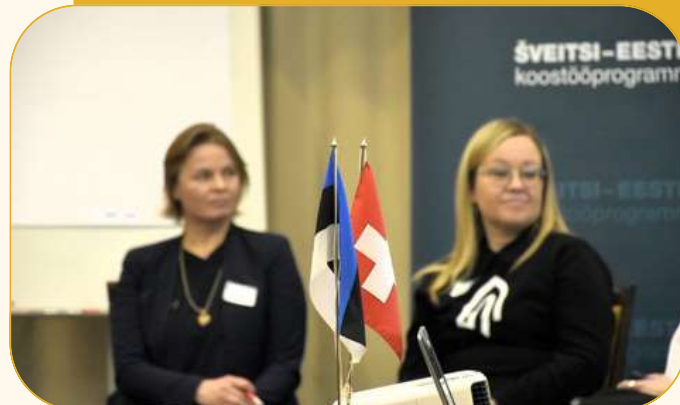
Eesti-Šveitsi koostööprogrammi KÜSKi osalusega meetme avasündmus.

Seda nii organisatsiooni arendamiseks, konkreetsete tegevuste planeerimiseks, tegevuseks vajaliku raha kavandamiseks ja juhtimiseks (sh omatulu teenimise arendamiseks), kommunikatsioonitegevusteks, teenuste, koostöö arendamiseks ja oma mõju hindamiseks jne.