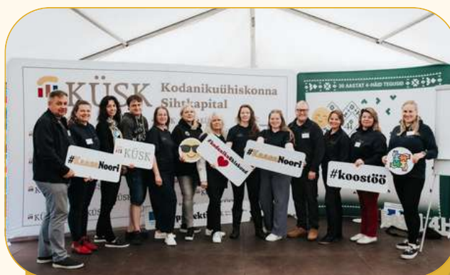
KÜSKi kollektiiv SUMINARil 2025.

KÜSKi rahastustaotlusi hindavad hindajate kogu hindajad – kodanikuühiskonna erinevate valdkondade eksperdid, kes nimetati 2025. aasta veebruaris pärast tihedat uute hindajate konkursi perioodiks 2025–2027.