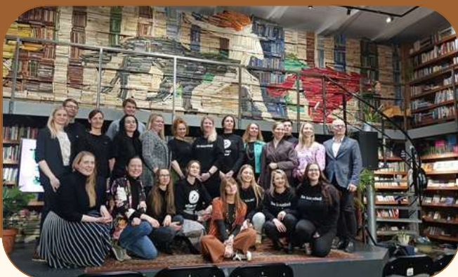
NULA 9. hooaja lõpu- ja 10. hooaja avasündmus.

Nupukate lahenduste ehk NULA inkubaator ja starditoetuste konkurss on toimiv koostöö Heateo SA-ga, kes on NULA inkubaatori rakenduspartner aastatel 2024–2026. NULA inkubaator pakub inimestele ja meeskondadele mentorlust kogu arenguprogrammi käigus. Senise kogemuse põhjal on NULA inkubaator aidanud uuenduslikel ideedel kiiremini kasvada elujõulisteks sotsiaal- või äri-projektideks. Kogu arenguprogramm peab kaasa aitama mõne elulise kitsaskoha lahendamisele ja uuendusliku idee väljatöötamisele, millel on innovatiivne ja sotsiaalne mõõde. 2025. aastal lisati inkubatsiooni 10 uut meeskonda.