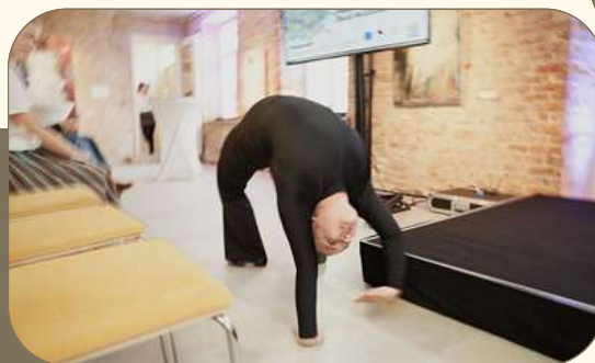
Kogemuspäeva teema oli „Painutame traditsioone“, aga lisaks painutati ka inimesi.

Avamata jäid kogukonnafondi ning vabaühenduste arenguhüppeks ja vabaühenduste arenguhüppe ettevalmistuseks mõeldud taotlusvoorud. Huvi nende toetusmeetmete avamise ja ajakava vastu on nii varasemate toetuse-saajate kui ka esmakordsete taotlejate seas olnud suur.