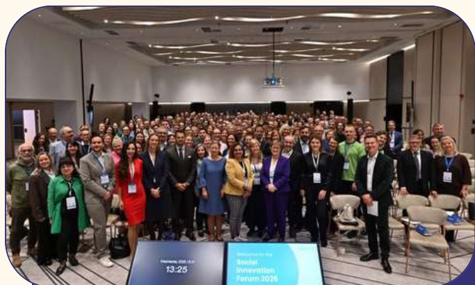
Sotsiaalse innovatsiooni foorum.

2025. aasta tegevused toimusid mahus 15 939 eurot .