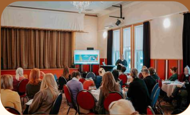
Kogukondadevahelise koostöö teemadele pühendatud arengupäev.

Kontaktpunkti tegevusteks kasutati 2025. aastal 31 118 eurot .