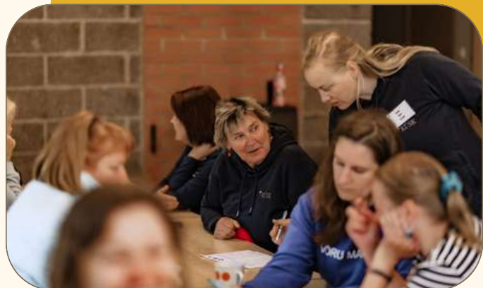
Suminaril lõppes vabaühenduste konsultantide arenguprogramm.