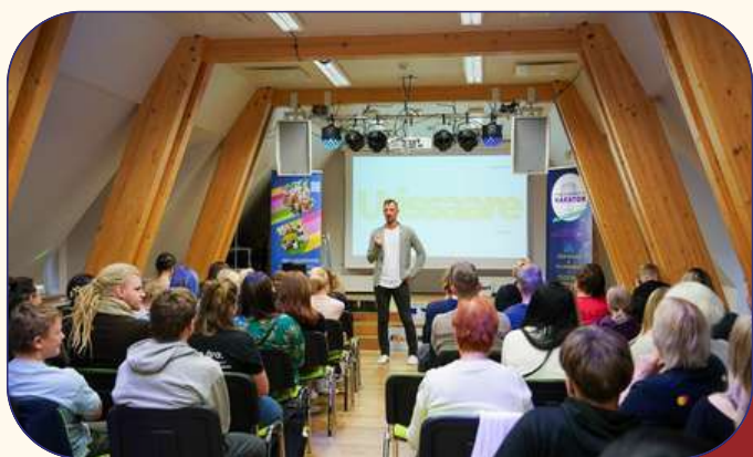
Viljandi- ja Jõgevamaa noorte ja kogukondade häkaton.

2025. aastal teostati tegevusi mahus 431 285 eurot.